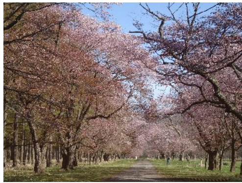
静内二十間道路 桜のトンネル

大切なことは、あくまでも相手に迷惑をかけないことです。楽しい毎日を通じましょう！