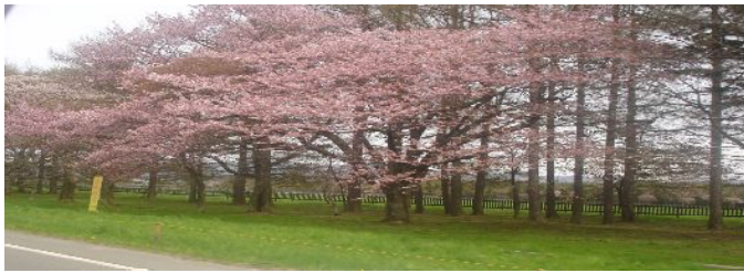
浦河町優駿ビレッジ あえる